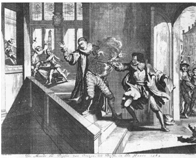
De moord op Willem van Oranje, 10 juli 1584