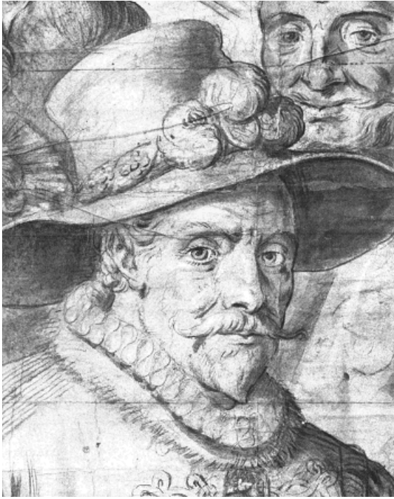
Willem van Oranje